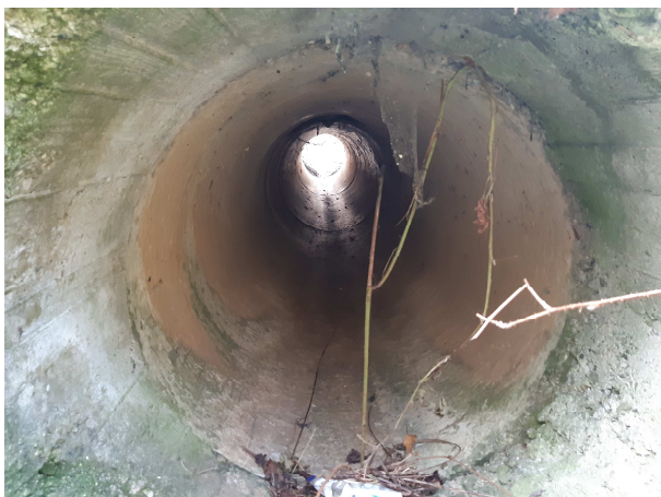
Pohľad do telesa priepustu

Samotný teleso priepustu je čisté. Kalová jama zachovalá, rímsa poškodená. Výtokové čelo zachovalé, rímsa rozrušená.