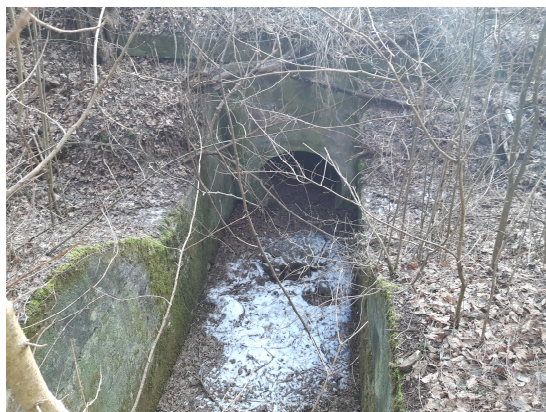
Pohľad na vtok