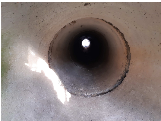
Pohľad do telesa priepustu

Samotný teleso priepustu je čisté. Kalová jama mierne poškodená. Výtokové čelo zachovalé.