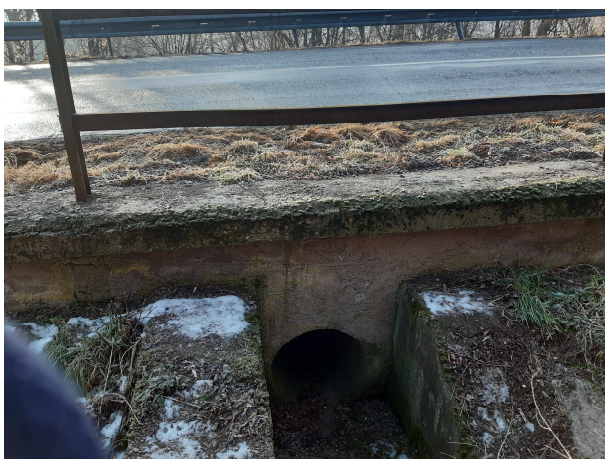
Pohľad na vtok