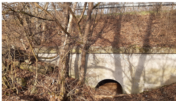
Pohľad na výtok