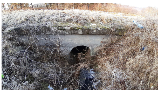
Pohľad na vtok