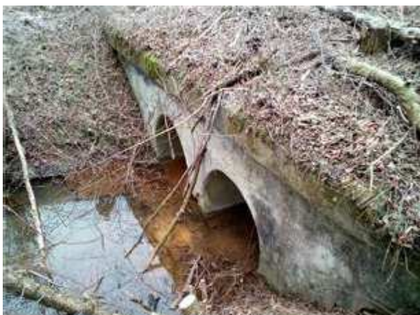
Pohľad na vtok