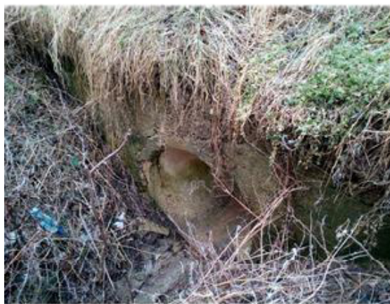
Pohľad na výtok