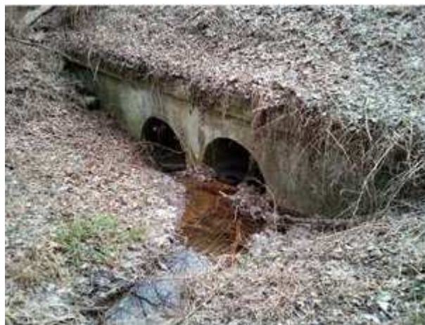
Pohľad na výtok

Samotný teleso priepustu je zanesené, prítomnosť stojatej vody. Vtokové a výtokové čelo poškodené, rímsa rozrušená.