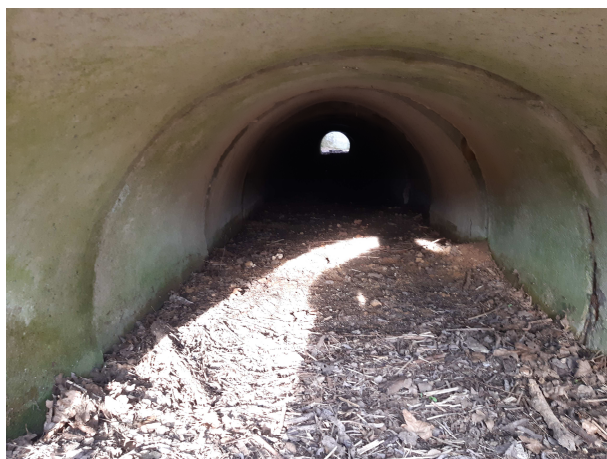
Pohľad do telesa priepustu

Samotný teleso priepustu je zanesené, trhliny v telese priepustu. Kalová jama poškodená. Výtokové čelo zachovalé.