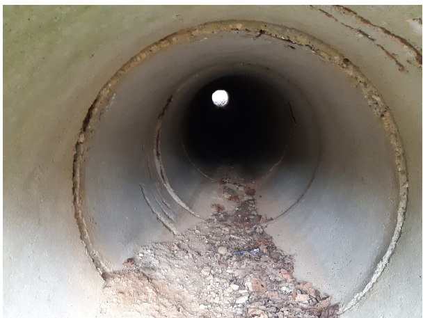
Pohľad do telesa priepustu

Samotný teleso priepustu je čisté, viditeľný posun DN rúry. Vtokové čelo zachovalé. Výtokové čelo zachovalé, rímša poškodená.