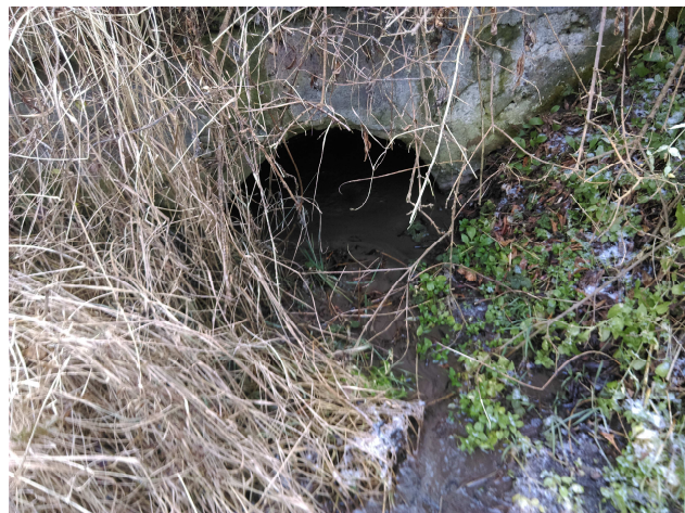
Pohľad na výtok

Samotný teleso priepustu je zanesené. Vtokové a výtokové čelo poškodené.