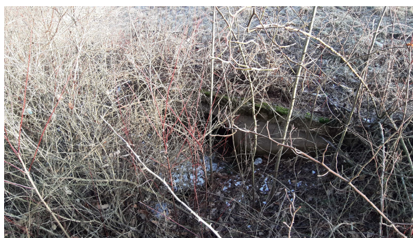
Pohľad na výtok

Samotný teleso priepustu je zanesené. Vtokové a výtokové čelo zachovalé, rímsa na vtoku a výtoku rozrušená.