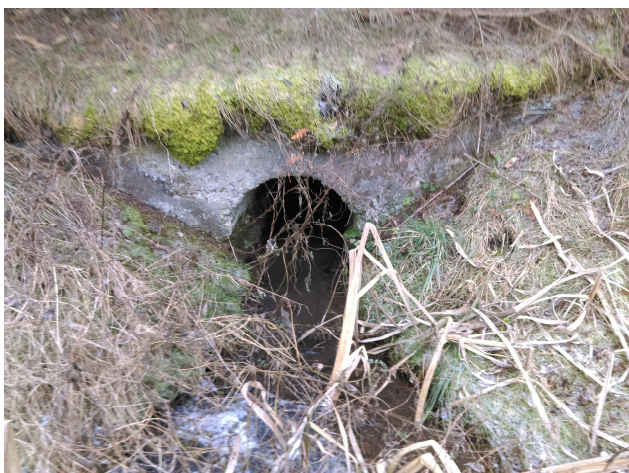
Pohľad na vtok