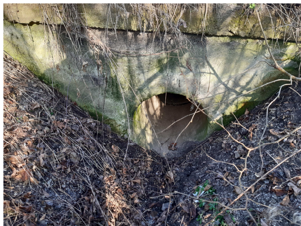
Pohľad na výtok