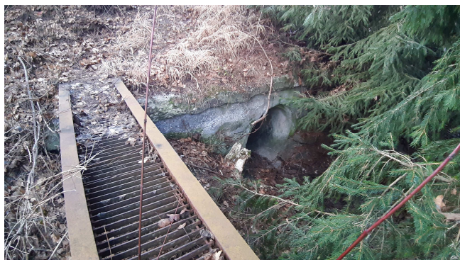
Pohľad na vtok