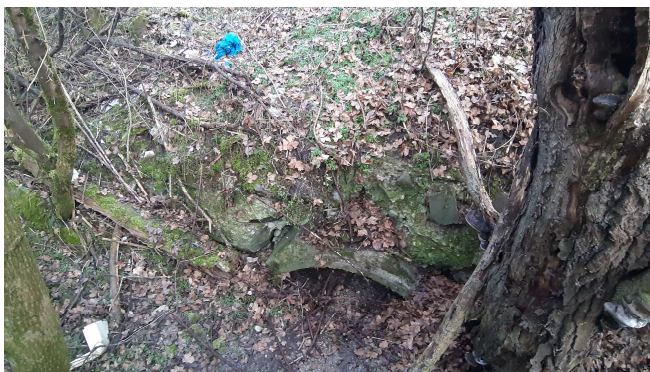
Pohľad na výtok

Samotný teleso priepustu je zanesené. Vtokové a výtokové čelo poškodené, rímsa rozrušená.