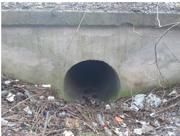
Pohľad na vtok