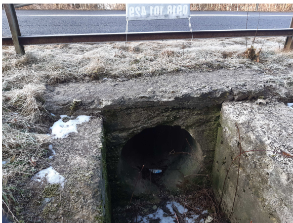
Pohľad na vtok